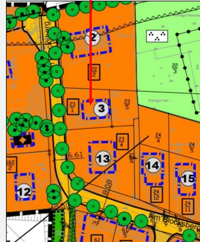
Darstellung des Baufeldes Nr. 3 im B-Plan Nr. 61

Das Baugrundstück ist öffentlich erschlossen; die Medien befinden sich in der Straße Am Blocksberg. Die jeweiligen Hausanschlüsse sind auf Kosten des Käufers herzustellen. Zur Klärung der technischen Anschlussbedingungen und Ermittlung der Erschließungs- / Hausanschlusskosten gibt der Bereich Hausanschlusswesen der Neubrandenburger Stadtwerke GmbH Auskunft.